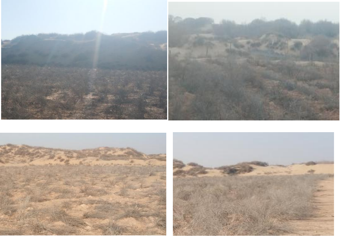
管线植被恢复情况